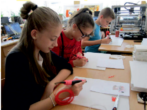
3D принтер; 3D писалки