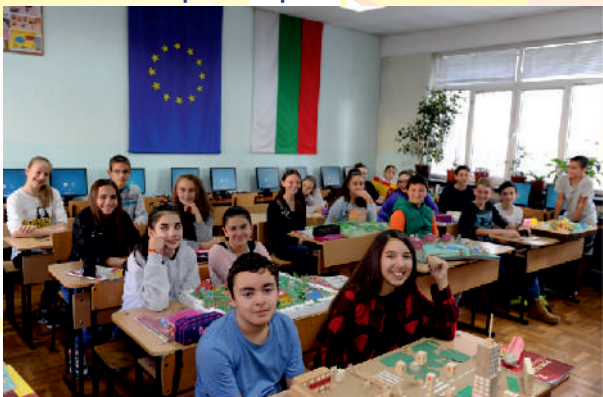
технологии и предприемачество